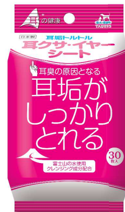
耳垢トルトル 耳クサ・イヤシート